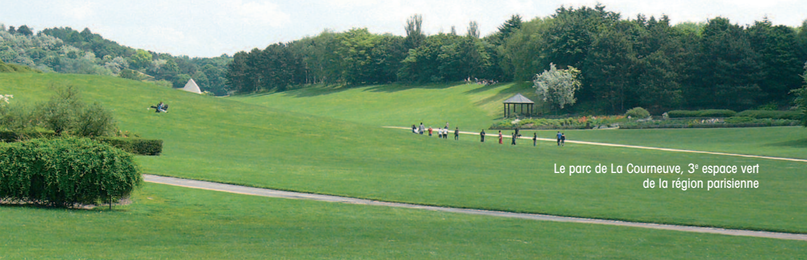
Le parc de La Courneuve, 3 ème espace vert de la région parisienne