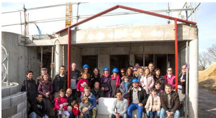
LE COL Habitat participatif, à Bayonne.