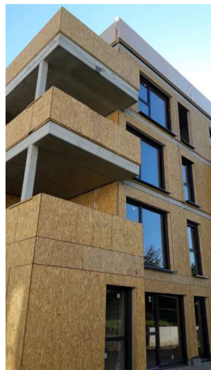
HABITAT DE L'ILL. Résidence Lieu Commun, en chantier. Strasbourg.