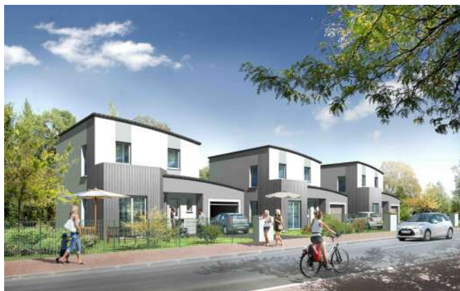
DOMENDI Maisons d’En France, Bruyères-le-Châtel (91)

▶ L’après-livraison : une fois votre maison livrée, votre COOP’HLM reste à votre écoute pour vous aider à bien vivre dans votre maison neuve. Elle s’engage à vous accompagner, à vous conseiller et à vous aider grâce à de nombreuses garanties qui vous couvrent après la livraison de votre maison.